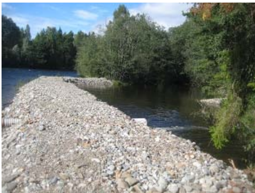
( Fylkesmannen i Buskerud )