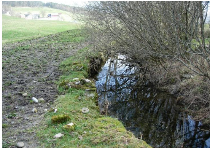
FIGUR 5. Ljoneselva ved Eidesvatnet.

Ljoneselva renn frå Eidesvatnet og ut i Ljonesvågen. Elva er 1-1,5 m brei og 900 m lang. Elvebotnen er av stein, grus og sand. Der den går gjennom jordbruksområde er den delvis forbygd. Elva ser ut til å vere svært næringsrik, det var eit sleipt algelag på botnen, og området rundt elva var dekkja med gylle. Vi fiska over halve elvestrekninga frå sjøen og opp til veggen og eit lite område før vatnet, men fann totalt berre tre aure, og desse var alle større enn 1+. Tettleiken av fisk var altså svært låg, og det vart derfor ikkje gjort vidare undersøkingar her. Vi observerte heller ingenting som skulle tilseie at elvemusling kunne leve her, snarare tvert i mot.