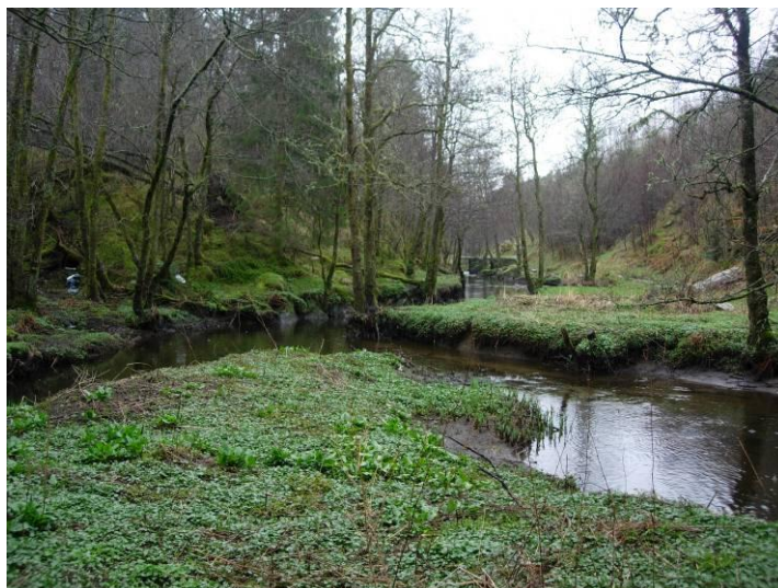
FIGUR 6. Mjåtveitelva 200 m ovanfor elveosen.

Vi samla inn fisk på strekninga frå elvosen til 100 m nedom hovudvegbrua. Det var middels høg tettleik av aure. Vi samla inn 33 aure av yngsteårsklasse. 11 av desse (33%) hadde glochidielarver på gjellene ( Tabell 2 ). Median infeksjonsintensitet var 8 glochidielarver per fisk ( Tabell 2 ).