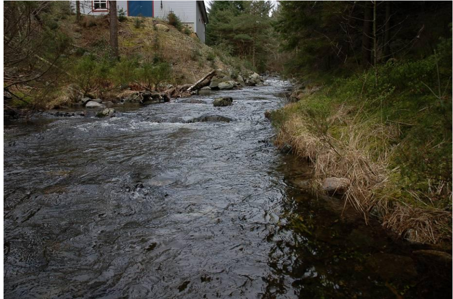
FIGUR 2. Nederste delen av Åreidelva.

Her vart det samla inn fisk den 27. april 2007. Vassføringa var høg og vasstemperaturen var 8,7 °C. Tre parti av elva på omlag 300 m 2 vart overfiska og 19 årsyngel av aure vart samla inn. To av nitten aure var infisert med glochidielarver. Median intensitet av infeksjonane var 3,5 glochidielarver ( tabell 2 ).