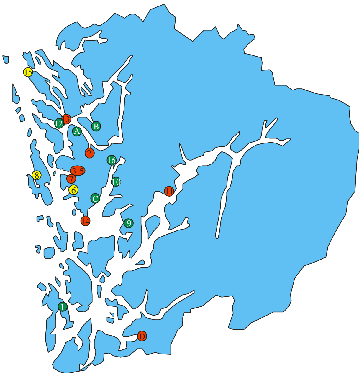
FIGUR 1: Elvemusling i Hordaland. Sirklar med tal viser lokalitetane som vart undersøkte i 2007. Grøn sirkel viser lokalitetar med reproduserande elvemusling, raud sirkel viser lokalitetar der elvemuslingen høgst sannsynleg er utdødd og gul sirkel viser lokalitetar der det er usikkert eller lite truleg at det nokon gong har vore elvemusling. Sirklar med bokstavar er lokalitetar i Hordaland der statusen til elvemusling er avklart i løpet av dei siste åra. A=Haukåselva i Bergen kommune, B=Lpneelva i Osterøy kommune, C= Oselva i Os kommune og D= Etneelva i Etne kommune.