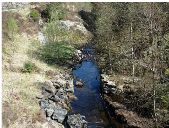
FIGUR 3. Nedre deler av elva som renn ut i Apalvågen.

Vi samla inn 29 aure av yngste årsklasse. Ingen hadde elvemuslinglarver på gjellene ( tabell 2 ).