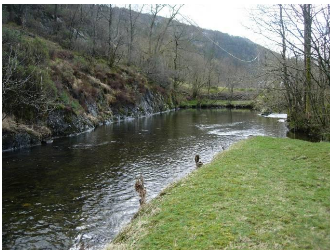
FIGUR 8. Skjelåna før siste fossen.

Nederste del av elva mot sjøen antok vi var påverka av saltvatn og ueigna for elvemusling, men vi har i ettertid fått tips frå ein grunneigar om at det skal vere elvemusling i dette området.