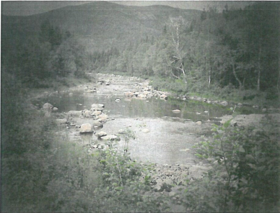
Like ovenfor planlagt inntak ved Rapfossan. Ingen elvemusling her.