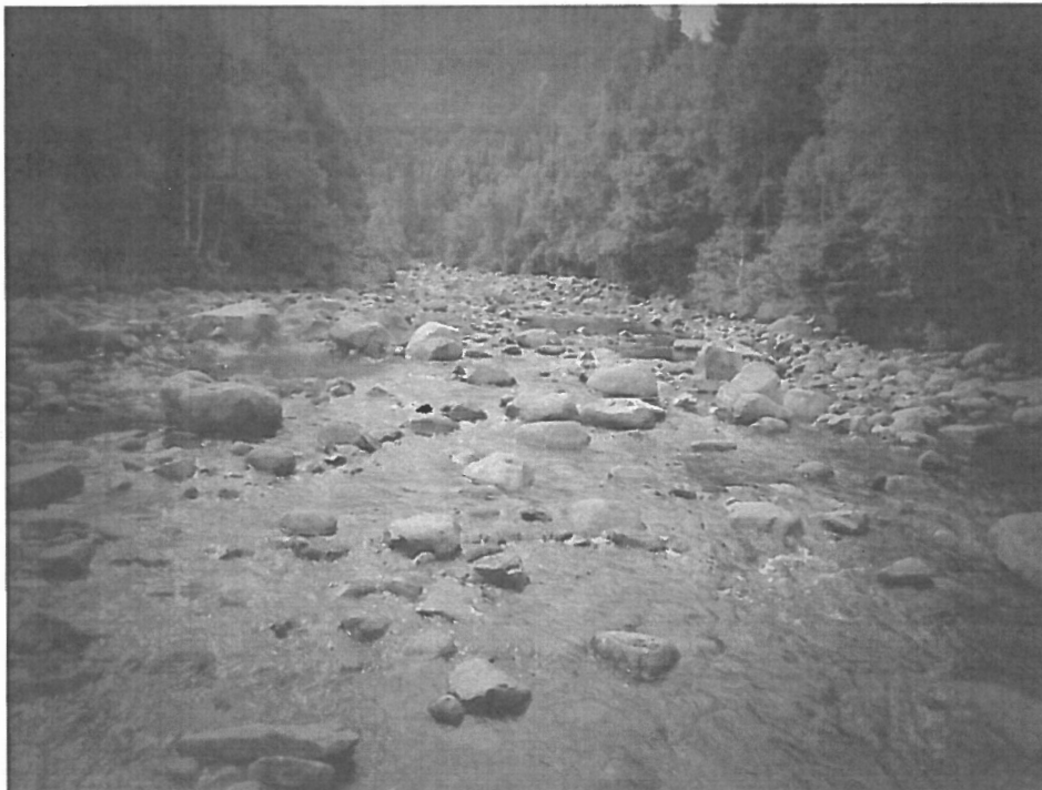
Potensielt god laksebiotop, men kun lav tetthet av elveaure ble funnet.