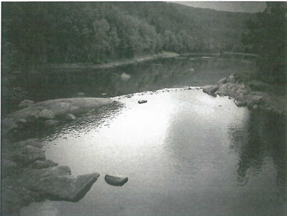
Ved utløpet av Holmtjern. Potensielt god muslingbiotop, men ingen musling registrert.