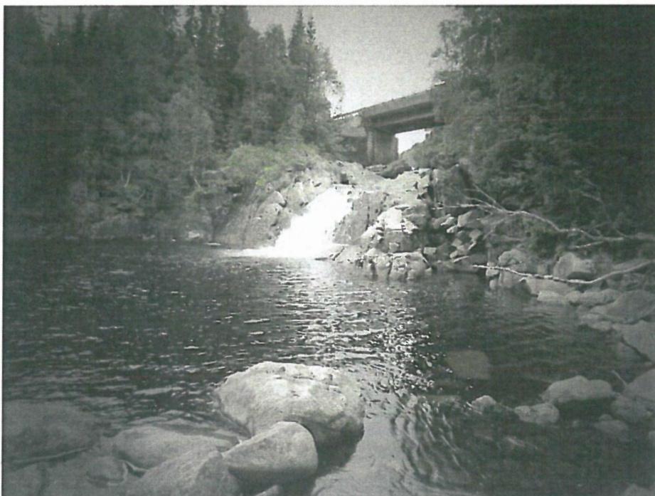
Storfossen i Oksdøla, grense for anadrom strekning.

Konklusjon: Det finnes ikke elvemusling på denne strekningen.