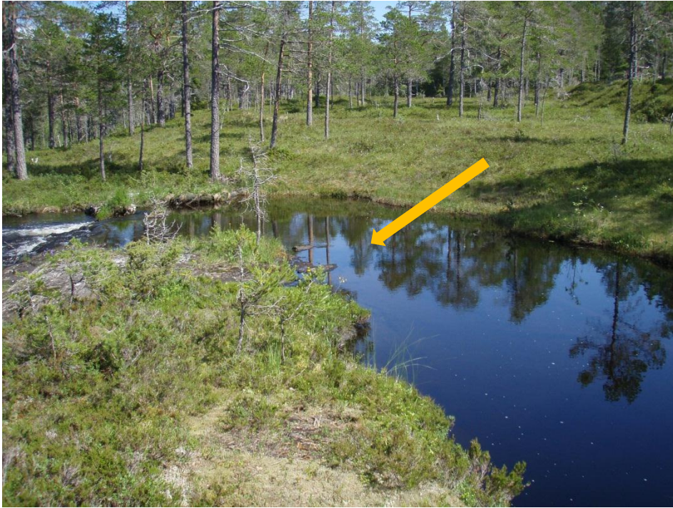
Bilde 1. Pilen angir funn av en musling nederst i denne hølen.