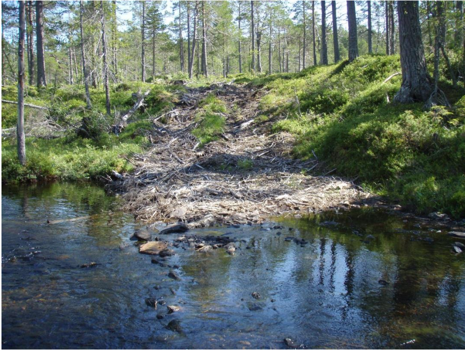
Bilde 3. Denne driftsvegen krysser elva like ovenfor der bilde 2 er tatt. Skogsdrift er sannsynligvis årsaken til at det er så mye trevirke i elva her, noe som muligens har ført til nedslamming av elvegrusen.