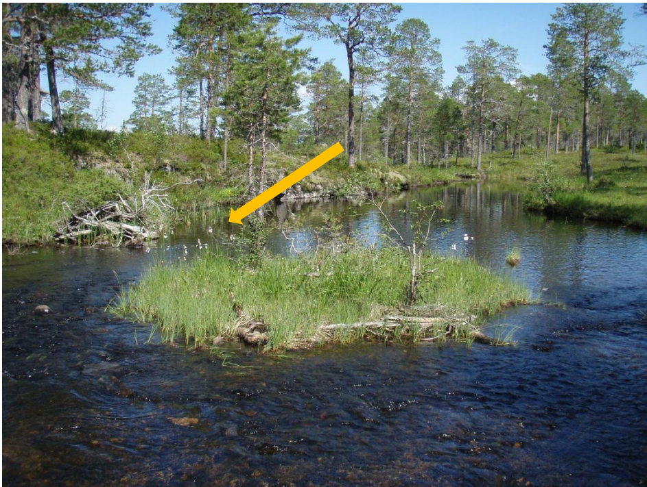
Bilde 2. Viser øverste del av hølen hvor de to muslingene ble funnet. Pil angir funnstedet.