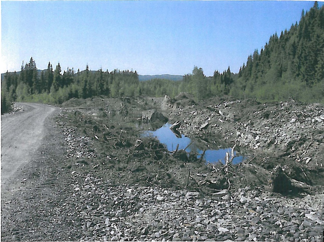
Steinbrudd på vestre side av vegen inn til Ausetvatn