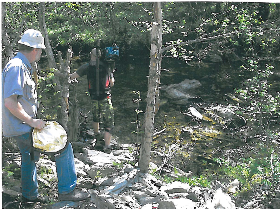
Sprengstein har også havnet i Borråselva