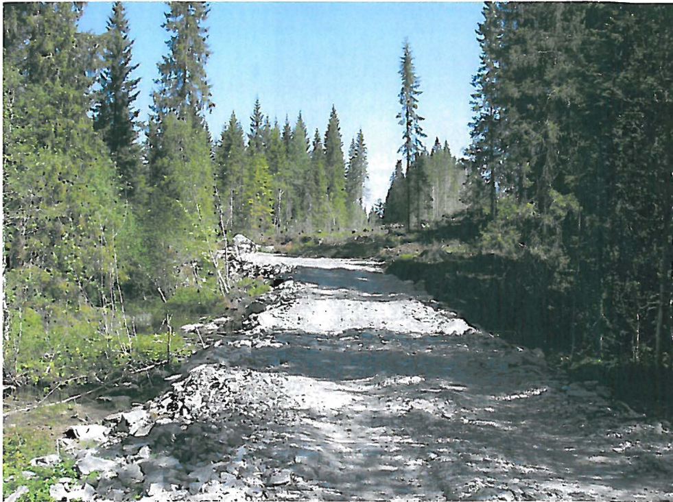
Vegtraseen som krysser Brekkelva.

Vegen mot dammen ved Ausetvatnet er også opprustet. Også her er vegen forlenget til østre side av dammen ved kryssing av Borråselva. Iflg Stjørdal kommune er det heller ikke søkt om tillatelse til forlengelse av denne vegen, kun til opprusting av eksisterende veg opp til vestre side av dammen.