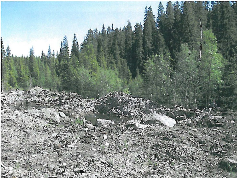
Steinbrudd mellom vegen og Borråselva.