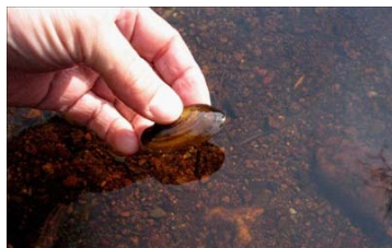
Gleder forskerne: Dette ferske elvemuslingbildet fra et sted i Kampåa har fått forskerne til å planlegge en tur til Nes for å undersøke lokaliteten.

Elvemuslingen (Margaritifera margaritifera)