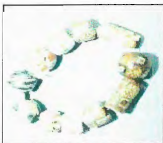
Jernalderperler funnet i grav på Spangereid i Lindesnes. Det