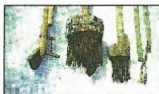
Redskaper som ble brukt til perlefiske. Bildet er hentet fra Lande og Storesunds artikkel fra 1999 - se kilder 1999 Photo: Bø Lokalmuseum ©Arne Lande og Asbjørn Storesund - FAUNA