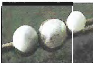
Perler fra Undalselven. Nå! gitt som konfirmasjonsgave på slutten av 1800-tallet. Sommer 2003