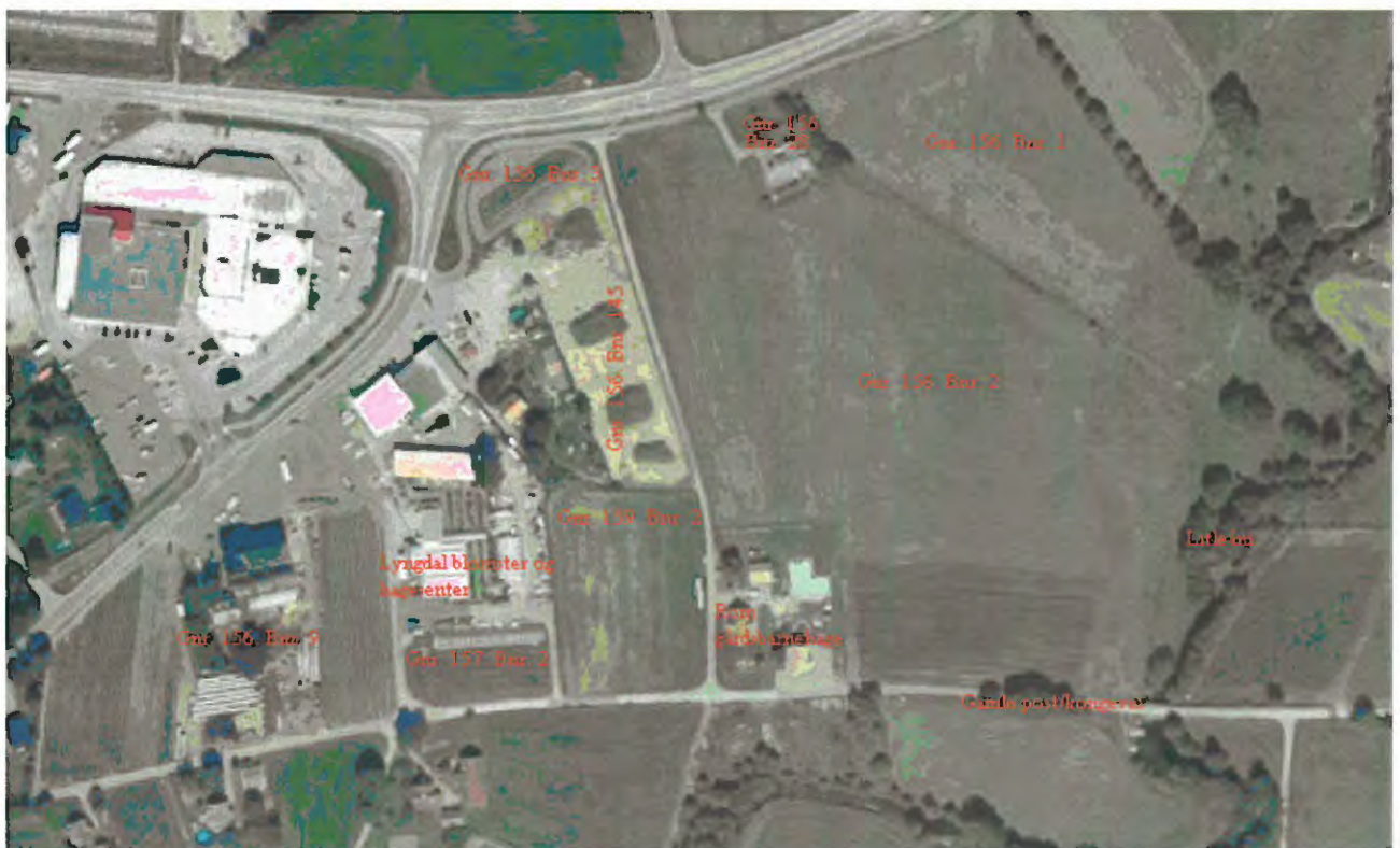
Ill 4: oversikt over gårds og bruksnummer hvor det ble foretatt undersøkelser, samt enkelte steder det er referert til i teksten.

Nedenfor vil resultatene fra registreringen bli presentert. Siden nummereringen av sjaktene ikke er fortløpende, vil resultatene bli presentert sortert etter gårds og bruksnummer. Gårdsnummer 156 med bruk 1 som ligger lengst øst i planområdet blir presentert først, og så følger de resterende gårds og bruksnummrene vestover. Nedefor er et flyfoto med gårds og bruksnummer markert, samt enkelte steder som det blir referert til i teksten, som Litleåni.