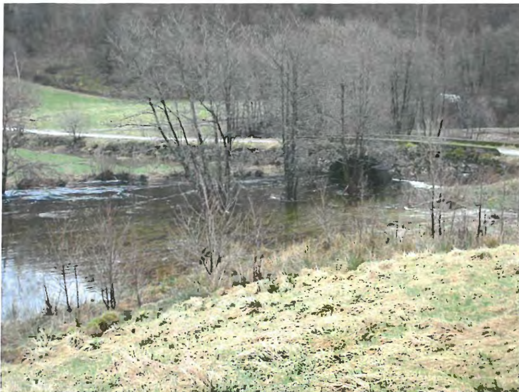
Ill 3: Hagen bro som krysser Liteåni.