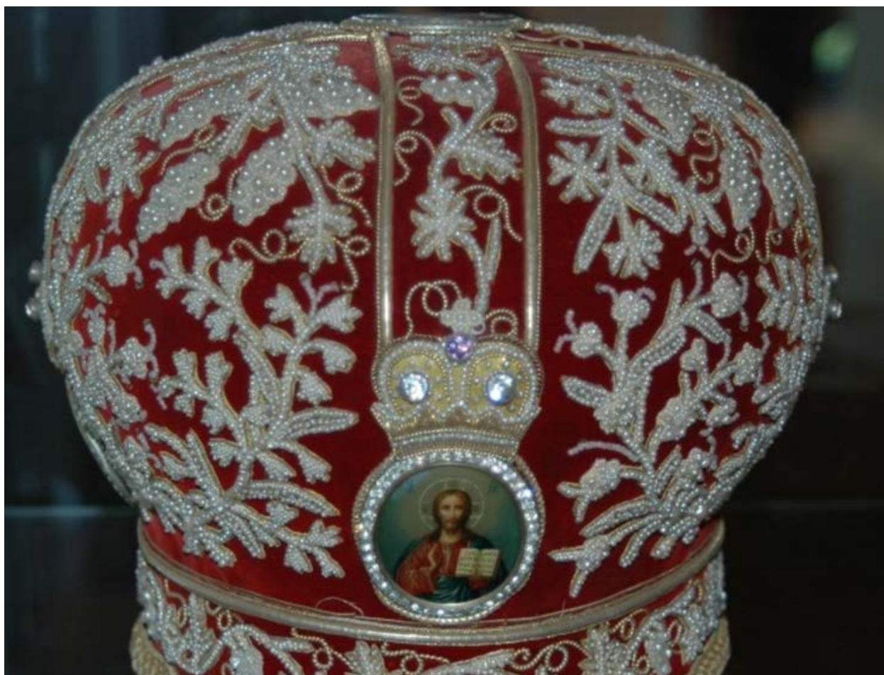
Figur 2. Luen til presten (Andarkinen) i klosteret i Pechenga, denne er prydet med blå elvemuslingperler og er laget ca 1880.

Historiske kilder deles gjerne i muntlige og skriftlige kilder. Det er lett etter ulike skriftlige kilder i biblioteker, arkiver og museer. Skriftlige kilder kan for eksempel være bøker, hefter, avtaler, ulike saksdokumenter eller kart. Muntlige kilder deles gjerne inn i førstehånds, andrehånds eller tredjehånds informasjon. Førstehåndsinformasjon er informasjon hvor kilden selv har opplevd det som det informeres om, mens andrehåndsinformasjon er videre fortalt av en person som har fått sin informasjon av den som opplevde informasjonen. Ved tredjehåndsinformasjon er det flere ledd (to eller flere) mellom dem som forteller og den/dem som har opplevd informasjonen. I tredjehåndsinformasjon har ofte navnet på førstehåndskilden forsvunnet. Deretter kommer anekdoter eller ulike typer fortellinger eller fragmenter/fragmenter av informasjon. Ut over dette så har man ulike kulturobjekter for eksempel; sanger, stev, joiker, eller ulike typer fysiske objekter for eksempel perleringer, broderier, klær eller tre/metallarbeider.