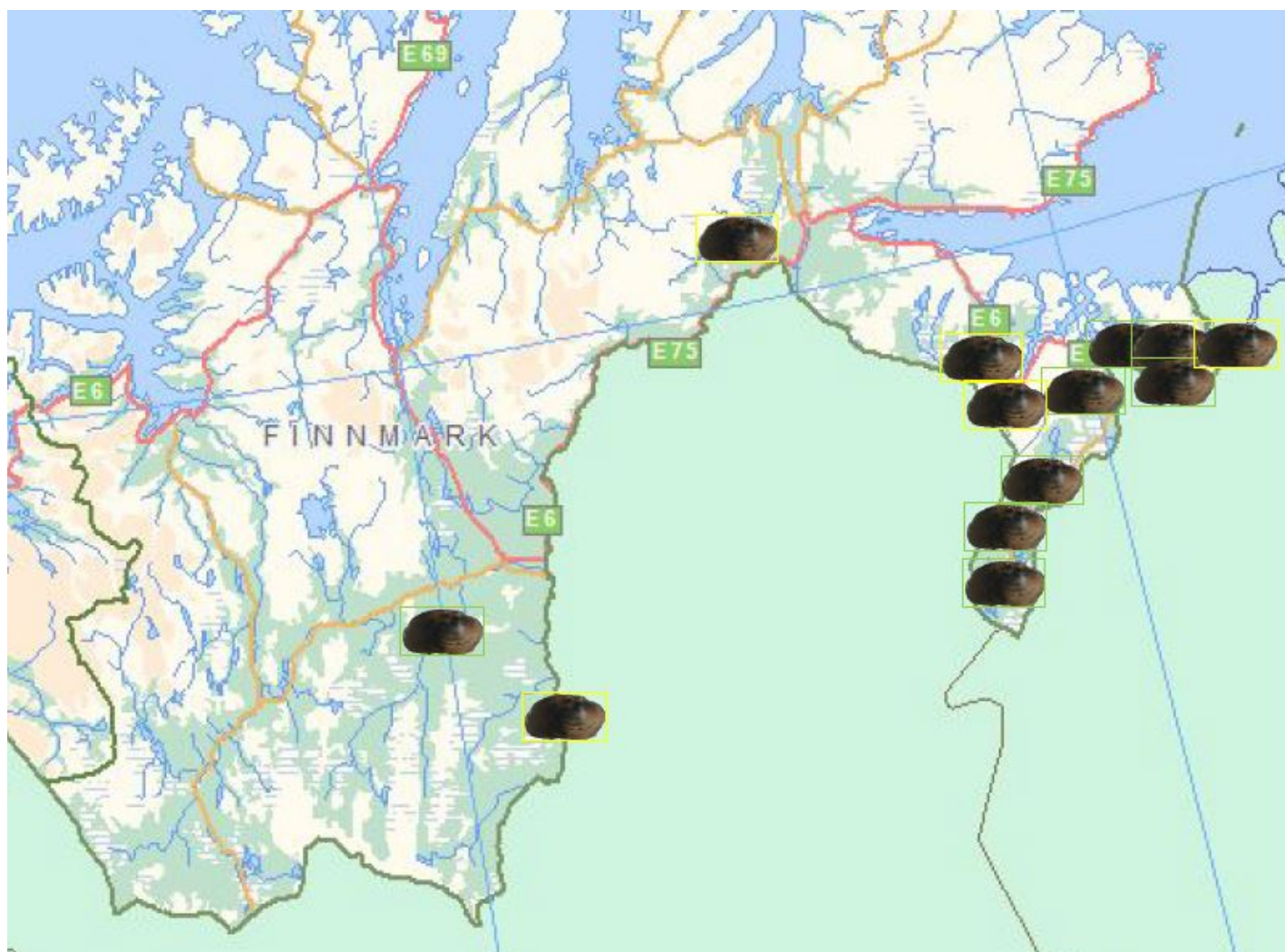
Figur 8. Kart som indikerer lokalitetene med elvemusling, jfr tabell 1. Illustrasjon av elvemusling med grønn ramme, indikerer historisk informasjon og dokumentert tilstedeværelse av elvemusling i nyere tid. Gul ramme indikerer historisk informasjon og at det er mulighet eller sansynlighet at man vil kunne finne elvemusling i disse lokalitetene.