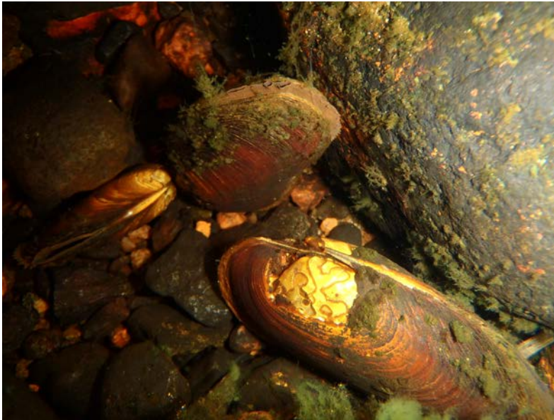
Figur 4. Yngre (til venstre) og eldre elvemuslinger finnes mange plasser i Karpelva, men på enkelte strekninger er det bare eldre individer.

Jordbundens ved Pasvig - Elv, hvor der fanges megen Lax, tror Linné siemen at være skikket, vist for Potates, om ikke for Korn; thi Græsjet være frodigt der, fordi Jorden ved Skovene meget besyttes med Stalden. I denne Elv findes ogsaa nogle Svaner. I Neiden Elv fanges, foruden en Menge Lax ogsaa nogle Perler; omkring den en Græsengens gade. I Jarfjorden, og Lax-Elven der findes i denne, fanges foruden Lax ogsaa nogle Østers.