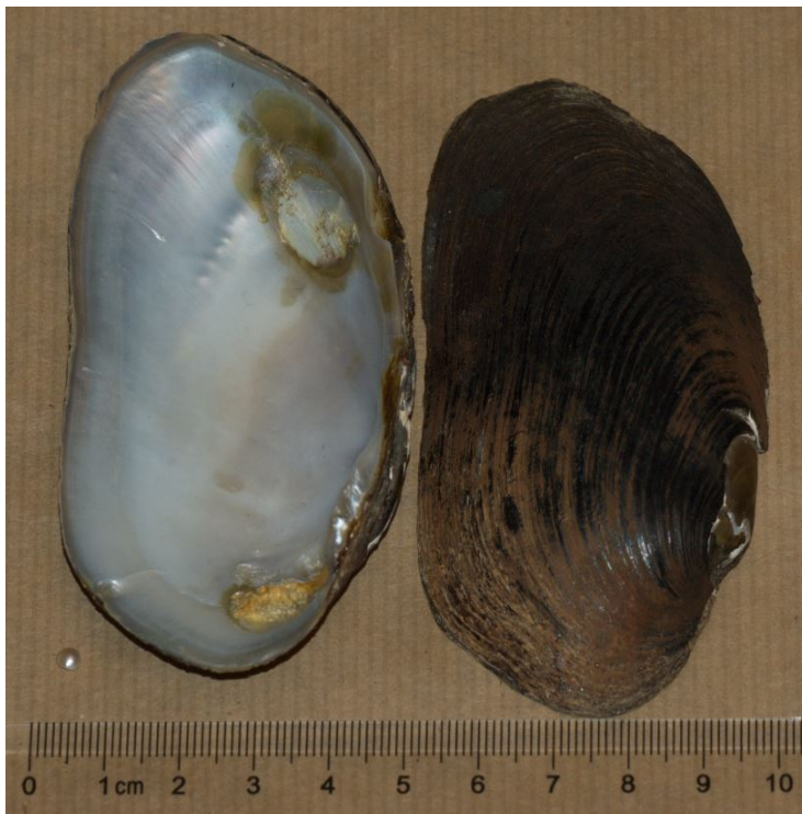
Figur 3. Bildet av elvemuslingen som ble funnet oppstrøms Jordanfoss i 1992.

Det er flere tredjehåndsinformasjoner om at det var elvemuslinger i selve Pasvikelva; Grensefoss, Jordanfoss, Ulvestryka og Melkefoss. På begynnelsen av 1990-tallet fant en dykker en levende stor elvemusling som krøp på muddret oppstrøms Jordanfoss. Dykk i Pasvikelva viser at bunnen har forbedret seg i løpet av de siste 10 år, det virker som det er mindre slam og mudder i delene med strøm. Det er klart at den store tømmerfløtingen på slutten av 1880-tallet og frem til 1930-tallet gav en rekke negative konsekvenser. Når kraftutbyggingen etablerte de store oppdemningene forsvant store deler av storørretenes gyteområder i Pasvikelvas stryk. Det er foreløpig ikke påvist flere elvemuslinger i selve Pasvikelva. Det er også anekdoter om at det var til dels store mengder elvemusling på bunnen på døpestedet nede ved Boris Gleb. Slike forekomster har blitt funnet nærme munningen i andre lakseelver.