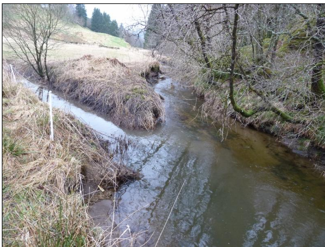
Figur 6. Ureininga frå anleggsoområdet er synleg i Mjåteitelva 15. mars 2012. Biletet viser samløpet mellom Mjåteitelva og elva som drenerer anleggsoområdet frå venstre.