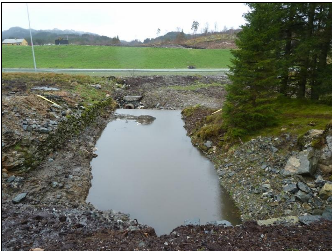
Figur 3. Øvre sedimenteringsbasseng som vart etablert av Walde utvikling. Biletet er teke 1. april 2012.