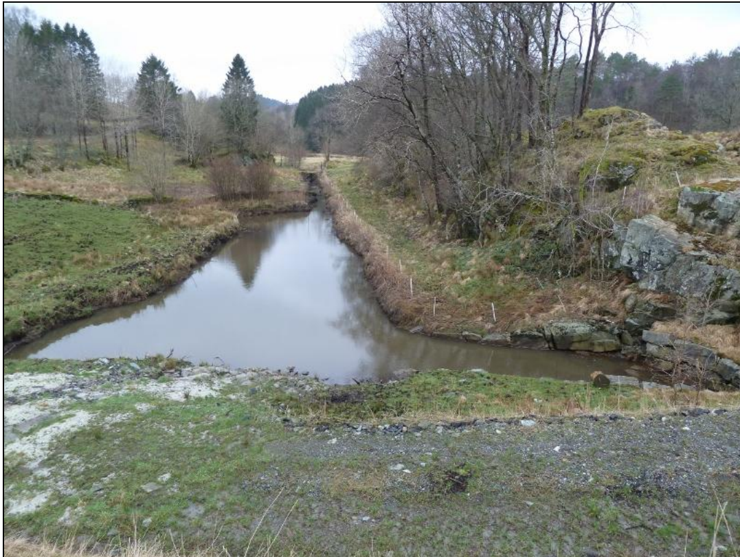
Figur 2. Nedre sedimenteringsbasseng som vart etablert i samband med jordtippen som biletet er teke frå 15. mars 2012.