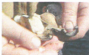
Smykke av elveperlemusling

Publisert 07.01.2002 13:51 - Oppdatert 07.01.2002 14:46