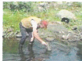
Oma på let i elven

Sjansen for å finne perle i elveperlemuslingen er større enn å finne nålen i høystakken. En kjenner kan se det på sporene på skjellet om der er perle inni. De som kan faget vet også hvor de skal lete. Det har med strøm og bunnforhold å gjøre.