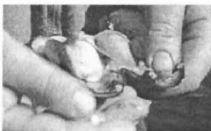
Smykke av elveperlemusling

■ VIDEO: Perledykk i Håelva Av John Skien og Arne Brommeland (Real Player 5.30) 40kbps