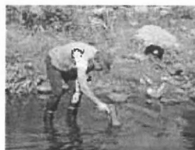
Oma på let i elven

Sjansen for å finne perle i elveperlemuslingen er større enn å finne nålen i høystakken. En kjenner kan se det på sporene på skjellet om der er perle inni. De som kan faget vet også hvor de skal lete. Det har med strøm og bunnforhold å gjøre.