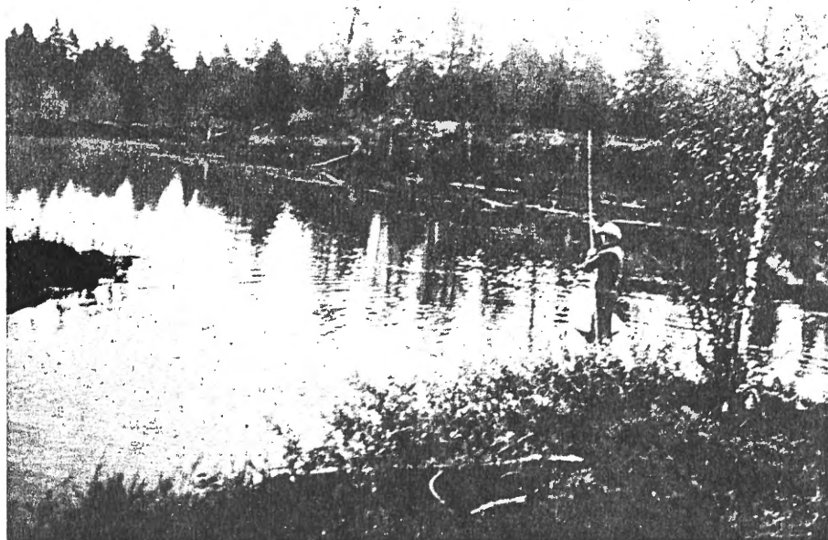
Idyll i elven.