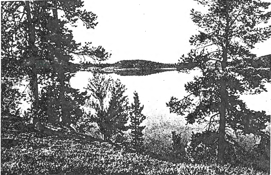
Utsikt fra Galggonjarga.