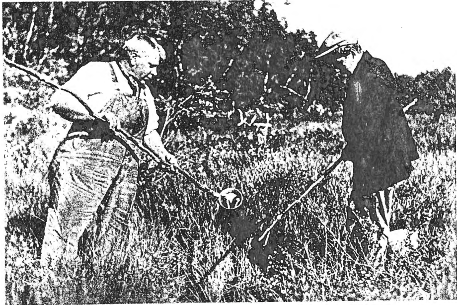
Perlefiske ved Hasetjern.