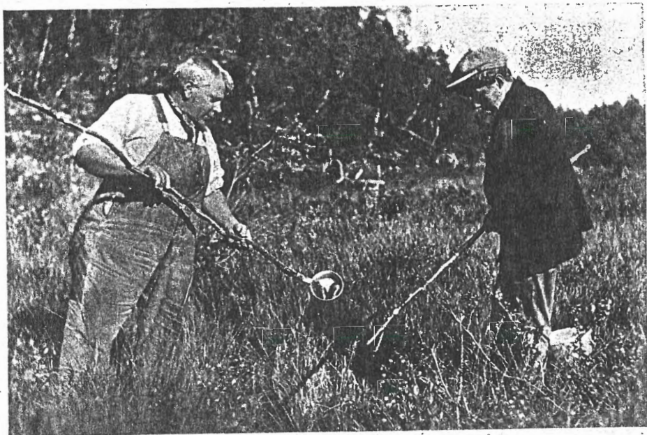
Perlefiske ved Hasetjern.