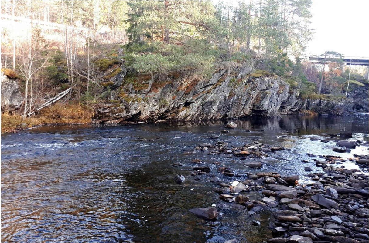
Undersøkellesområdet i Tevla. De fleste elvemuslingene ble funnet i området midt i bildet.