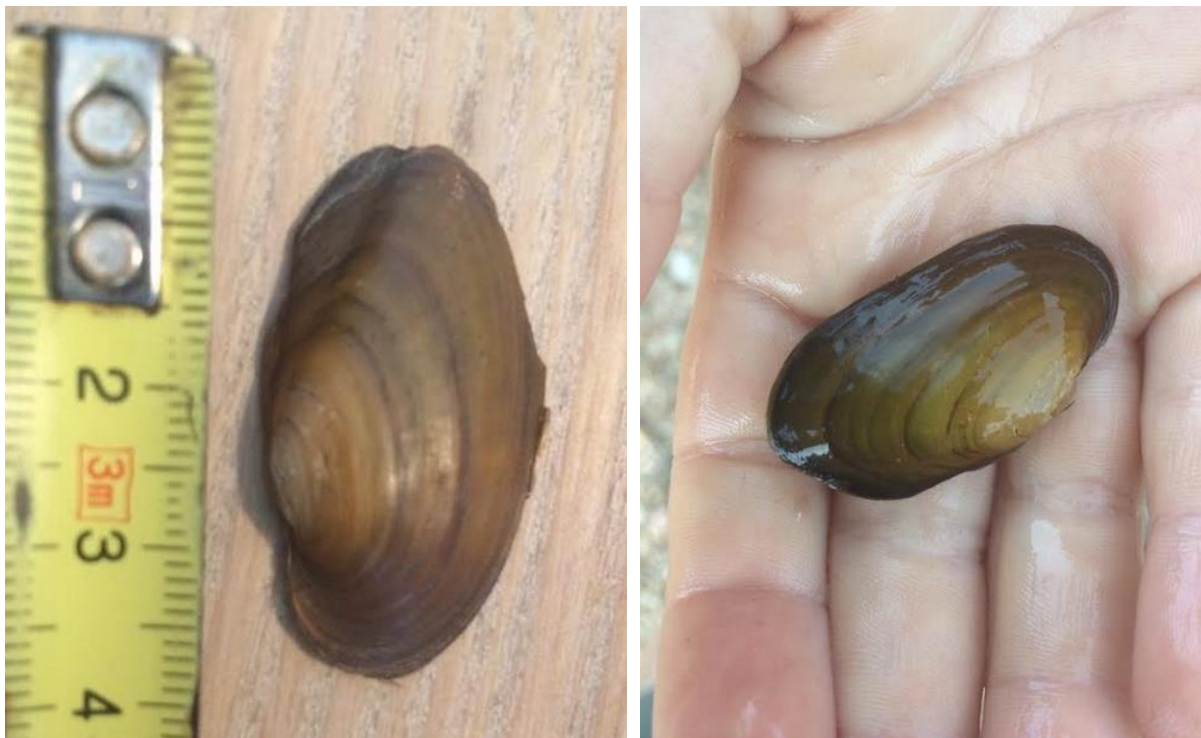
Figur 2. Tomt skall og levende elvemusling funnet ved Kjærestrom i Birkeland kommune 2018.