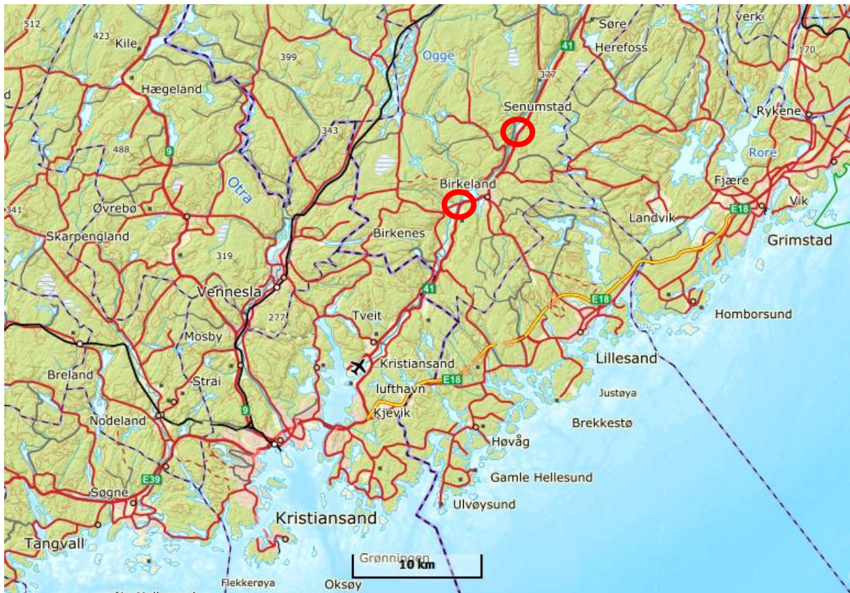
Figur 1. Funnsteder for levende elvemusling i Tovdalselva i 2018.