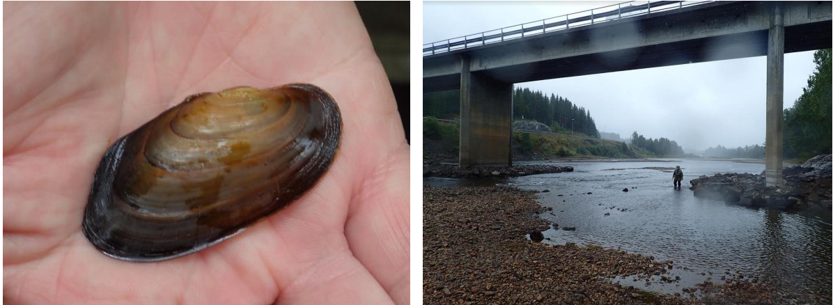
Figur 3. Levende elvemusling funnet ved utløpet av Flaksvatn i Birkeland kommune 2018.