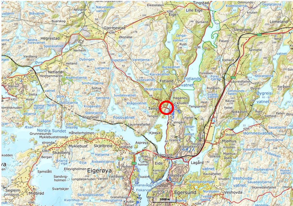
Figur 1. Funnsteder for levende elvemusling i Bjerkreimselva i 2020.