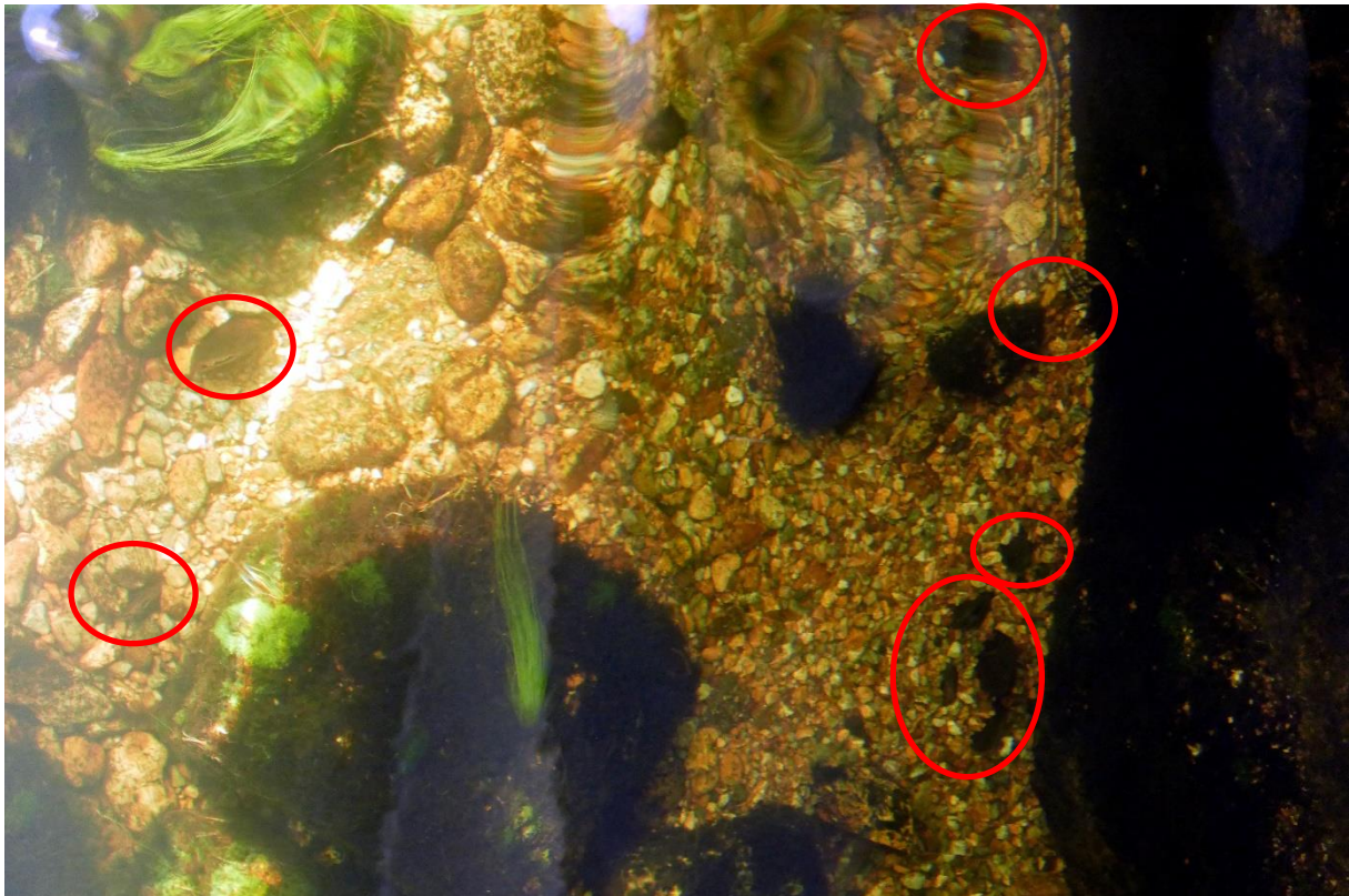
Figur 3. På bildet ses flere elvemuslinger, trolig 8-10 individer i ulike størrelser.