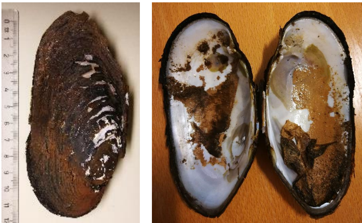
Figur 3. Et av de to skallene som ble funnet først. Inntørkede rester av bløtdeler synes på bildet, og perlemorlaget i skallet er ikke erodert. Muslingen må altså ha vært levende da vannet ble tappet ned i 2020.

Under feltarbeid 01.10.2020 fant Christian Toven nok et skall av elvemusling i samme område, men dette skallet hadde ligget tomt i mange år og var betydelig erodert, jf. figur 5.