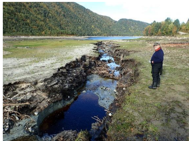
Figur 5. Øverste rad: Seterbakkens innløp i Bolgvatnet. Midtre rad: skallet som ble funnet 01.10.2020. Nederste rad: innløpsbekken i syd fra Prestmyra.