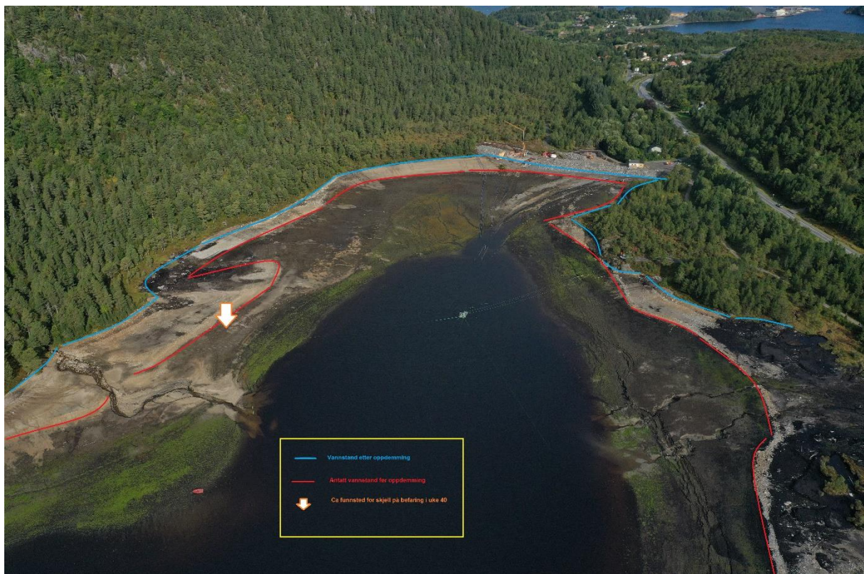
Figur 4. Dronefoto av Bolgvatnets nordre del som viser dammen, funnstedet for den tredje muslingen og den gamle strandlinjen fra før vannstanden ble hevet i 1913.

Skallet til den tredje muslingen har en vekt og størrelse som sannsynliggjør at det kan ha blitt flyttet med kraftig vind, men neppe langt.