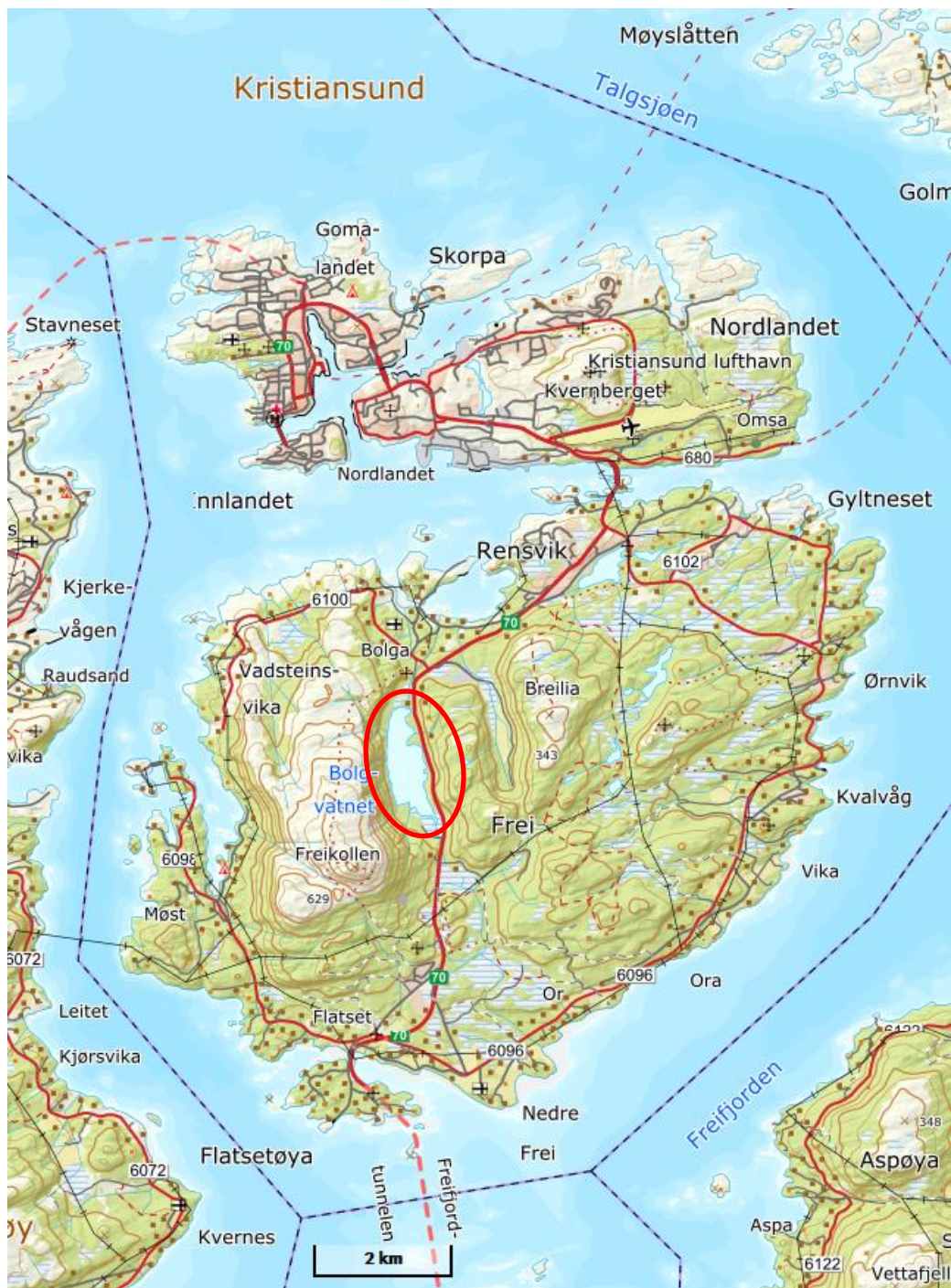
Figur 2. Kart over Frei og Bolgvatnet.

Bolgvatnet (jf. figur 2) er Kristiansund kommunes største innsjø, og ligger på øya Frei, i Møre og Romsdal. Vatnet har lengderetning omtrentlig nord-sør. Vannspeilet ligger 66 moh. Innsjøens overflateareal er 0,63 km 2 . Bolgvatnet er 1,8 km langt og 0,55 km bredt. Største dybde er ca. 16 m. Største øy Rastholmen ligger på østsiden. Utløpet er i nord til Bolgelva som munner ut i Bolgvågen. Riksvei 70 går langs østsiden av vatnet. Bolgvatnet fungerte som hovedvannkilde i Kristiansund og Frei til rundt 1980. Siden slutten av 1970-tallet har det vært krisevannkilde, men kan bli reservevannkilde, etter Storvatnet i Tingvoll kommune. Langs vestsiden ruver Freikollenmassivet og i øst Midtfjellet og Kistfjellet. Sør for vatnet ligger Prestmyra og Storbakken.