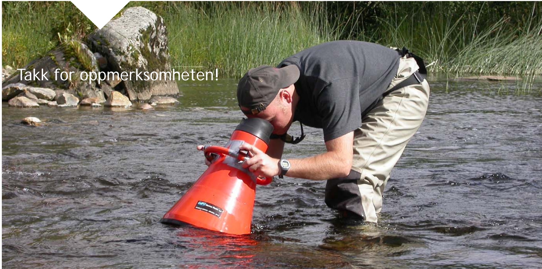
«Registrering av elvemusling»