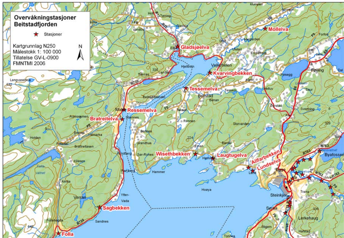
Fig 3. Overvåkingstasjoner i tilløpselver til Beitstadfjordens nordre del.

Overvåking ovenfor fiskesperrene i Byaelva (Byafossen), Oгна (Støa) og Figga (sperra på Lø) er foretatt med ujevne mellomrom. Sporadisk er røye fra Leksdalsvatn (øverst i Figga) og aure fra Lundselta (tilløpselv til Leksdalsvatn, må ikke forveksles med Lundselta nord for Steinkjer) analysert uten at G. salaris er påvist. Tidligere gode laksehabitater i Figga ovenfor fiskesperrea er elfisket uten at laks er påvist (inkl. sideelvene Døla og Skilja), kun aure er funnet. Tilsvarende er gode laksebiotoper ovenfor Støa i Oгна elfisket (Lauva, Møytla, Skillegrind) uten at laks er funnet. Ovenfor fossen i sideelva Rølla er det flere ganger elfisket, kun med aure som resultat. I Byaelva ovenfor Byafossen er strykområder i tilløpselva til Fossemvatnet (Forneselta) undersøkt, samt to tilløpsbekker til Reinsvatnet (Rådsbekken og Settenbekken), men kun aure ble påvist.