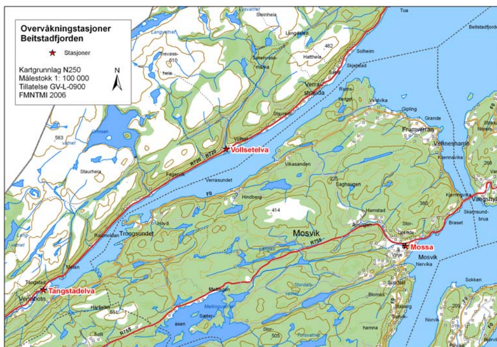
Fig 4. Overvåkingsstasjoner i østre deler av Beitstadjorden og Mossa.

Mossa drenerer til Trondheimsfjorden 5 km utenfor Skarnsundbrua og hører følgelig ikke til Beitstadjorden, men er nærmeste lakseførende vassdrag utenfor Skarnsundet. Mossa har bare rester av en laksebestand etter hard kraftutbygging. Laksebestanden i Mossa er overvåket årlig siden 1989. G. salaris er ikke påvist i vassdraget. Det finnes et kultiveringsanlegg for laks i Mosvik hvorfra det årlig settes ut 20.000 laksesmolt i Mossa.