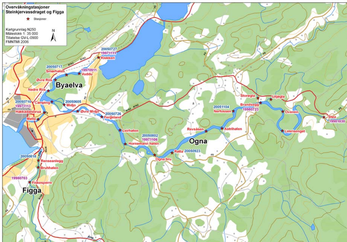
Fig.2. Kart som viser når G. salaris ble påvist i ulike deler av vassdragene henholdsvis i 1997/98 og 2005.

Ved rutinemessig overvåking ble G. salaris igjen påvist ved Midjo i nedre deler av Ogna på en prøve tatt 22. juni 2005 (på 3 av 16 laksunger). I løpet av vår/forsommer 2005 ble det tatt prøver i Byaelva og Figga uten at G. salaris ble påvist. Pga høy vår/forsommervassføring ble ikke prøver tatt i Steinkjerelva før 10.juli. Her ble G. salaris påvist på 10 av 33 laksunger (Håkkådalsbrua). G. salaris ble påvist i Smørhølen i Byaelva 17. juli (på 19 av 31 laksunger), på Fergeland i Ogna 26. juli (på 3 av 27 laksunger) og ved Hornemann i Ogna 2. august. I Figga ble G. salaris påvist på en av 56 laks fanget 18. august (prøver tatt i munningen). En begrenset rotenonbehandling ble gjennomført 26 og 27. august 2005 i Byaelva, Figga og Ogna nedenfor Ogna bru.