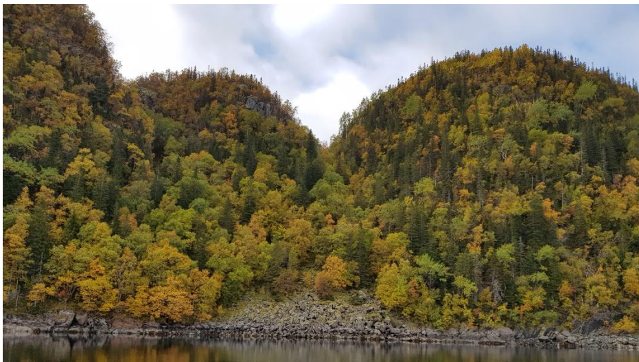
Gammel, boreal lauvskog, Liabogen.