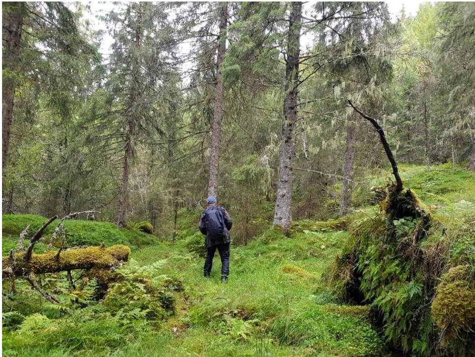
Bra biologi: Dødvved, mye hengelav, eldre trær.