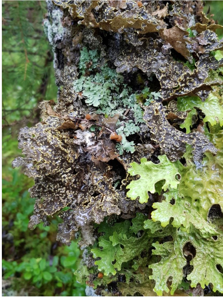
Gullprikklav og lobarionarter.