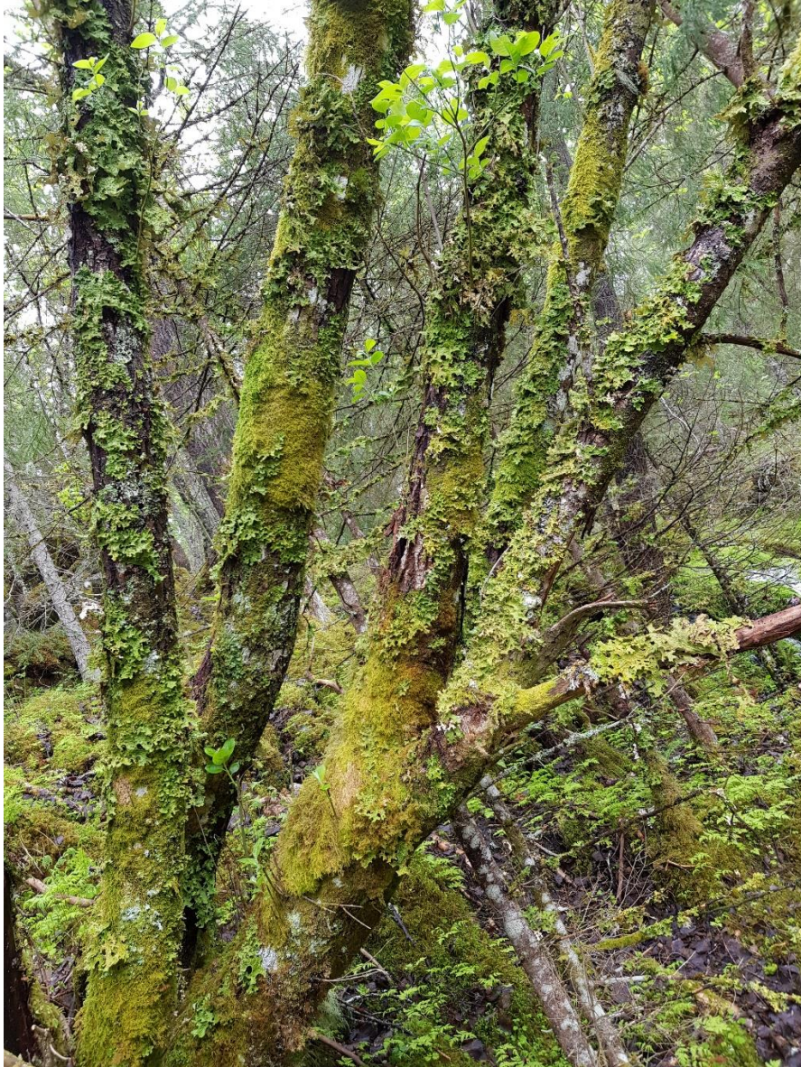
Lobarion på lauvtrær – svært fuktige forhold