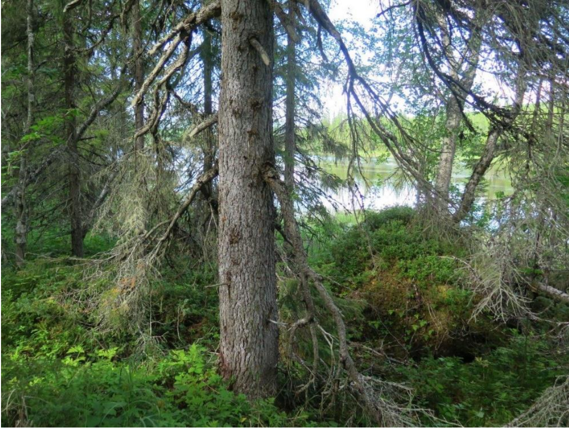
Gran med taigabendellav ved Julestrømmen. Vokser på tørre kvister.