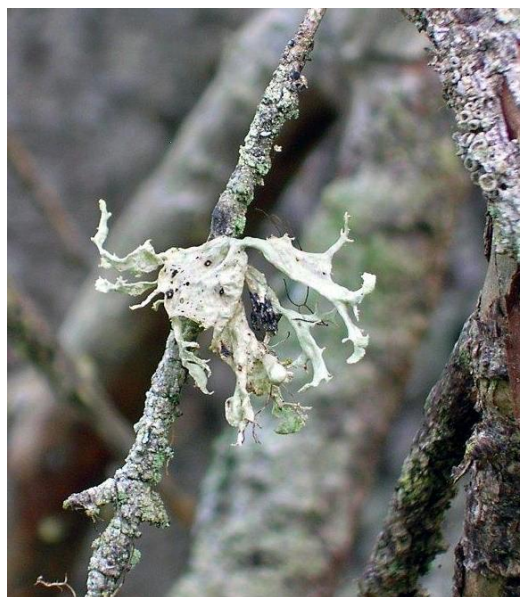
Hjelmragg, sterkt truet, vokser på tørre kvister.

Biofaglig inventør: Biofokus 2013/2019 Hofton, Miljøfaglig utredning 2017 Gaarder, Naturbase BN 00050393, befarings ved Statsforvalteren.