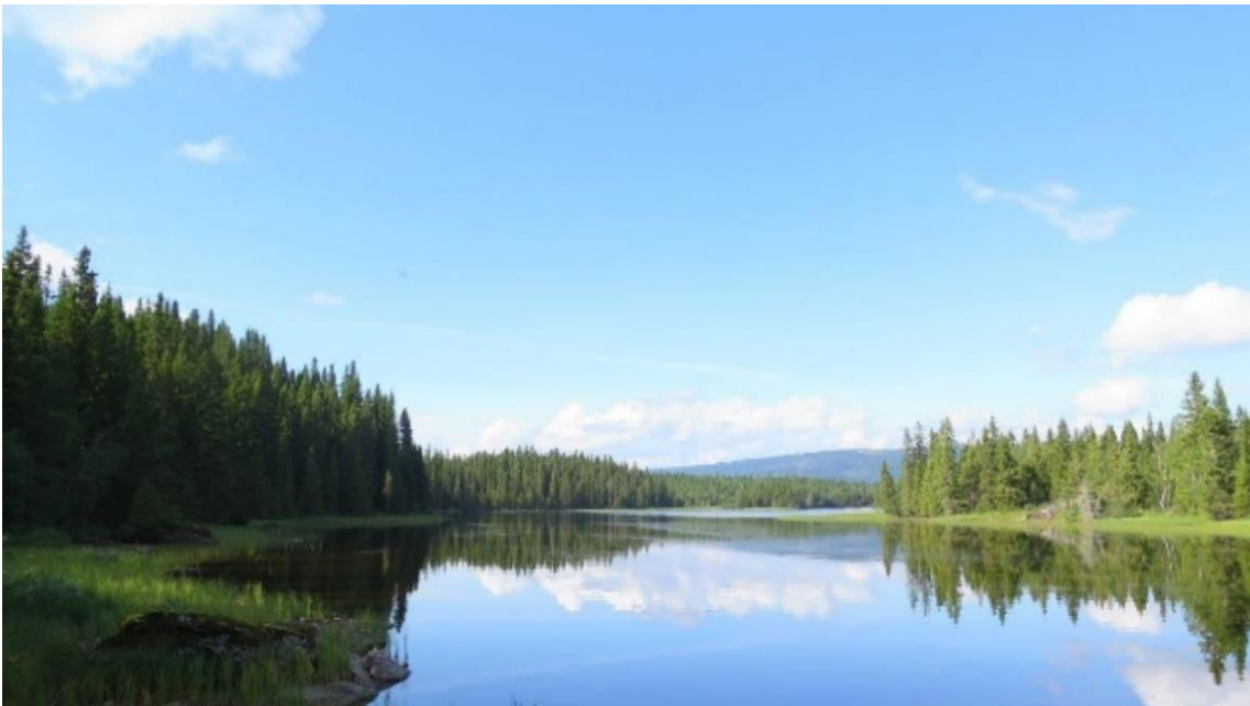
Julestrømmen, vernetilbudet er området på venstre bredd.