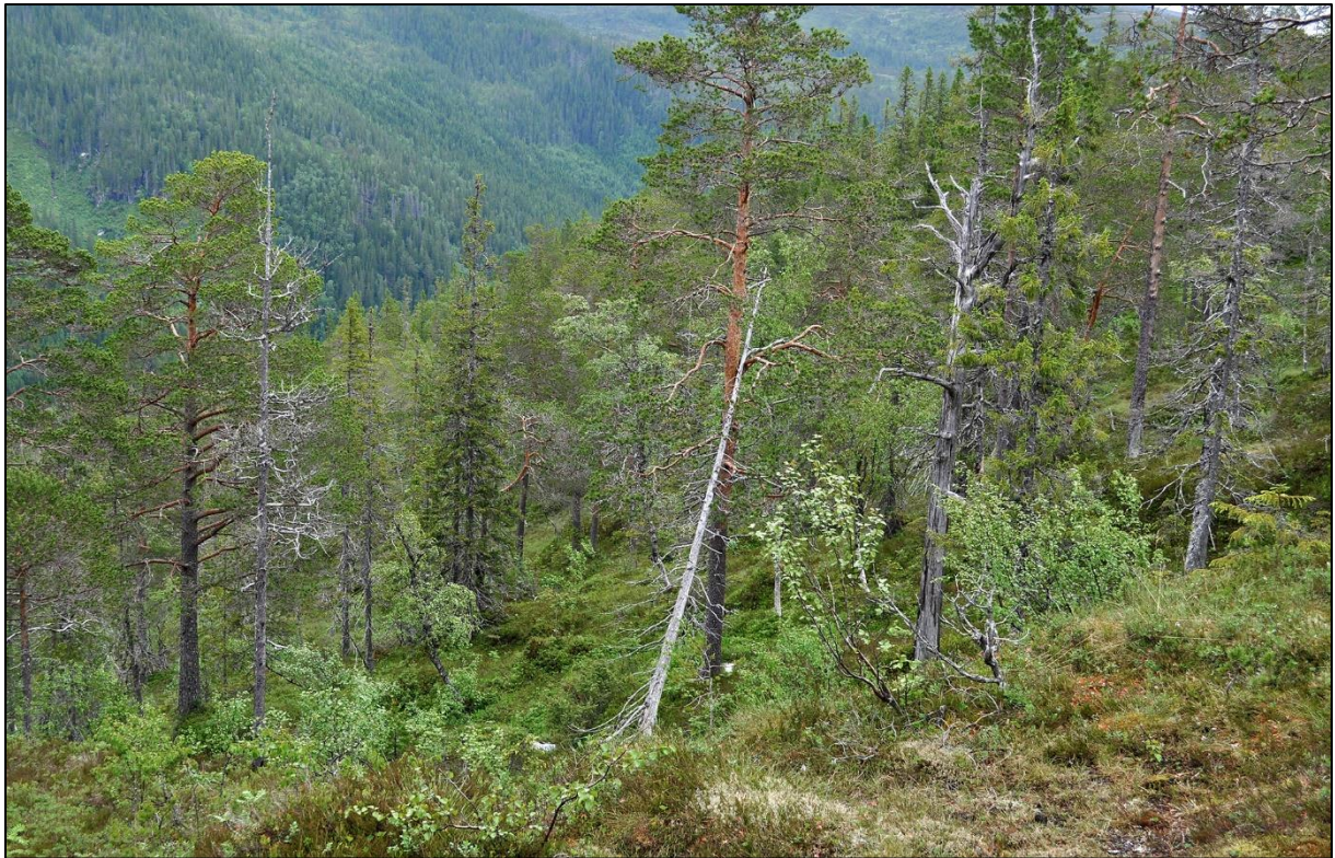
Lunkholmen, nordhellning, Reinåbølet på andre siden av dalen med sørhellning.