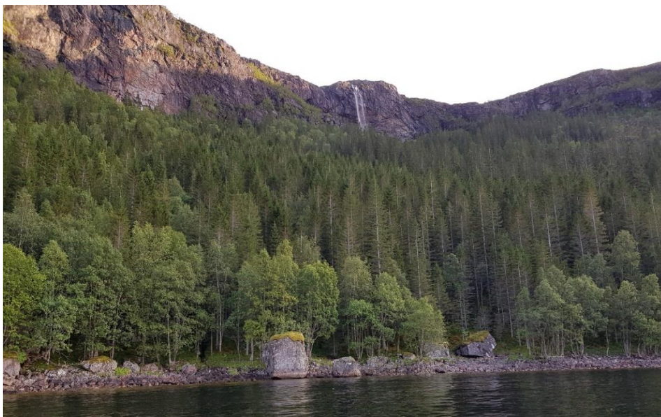
70 meter høyt fossefall og det finnes grantrær inntil 300 år gamle.

Biofaglig inventør: Biofokus 2019 Blindheim, Langmo.