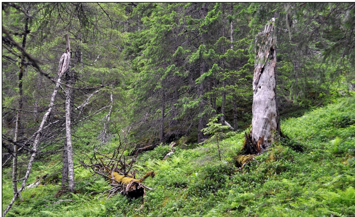
Liggende og stående død ved i Reinåbølet.

Biofaglig inventør; BioFokus 2020, Langmo. Biofokus 2017 Gaarder. Allskog 2018, Svensson. Befaring fylkesmannen (Statsforvalteren).