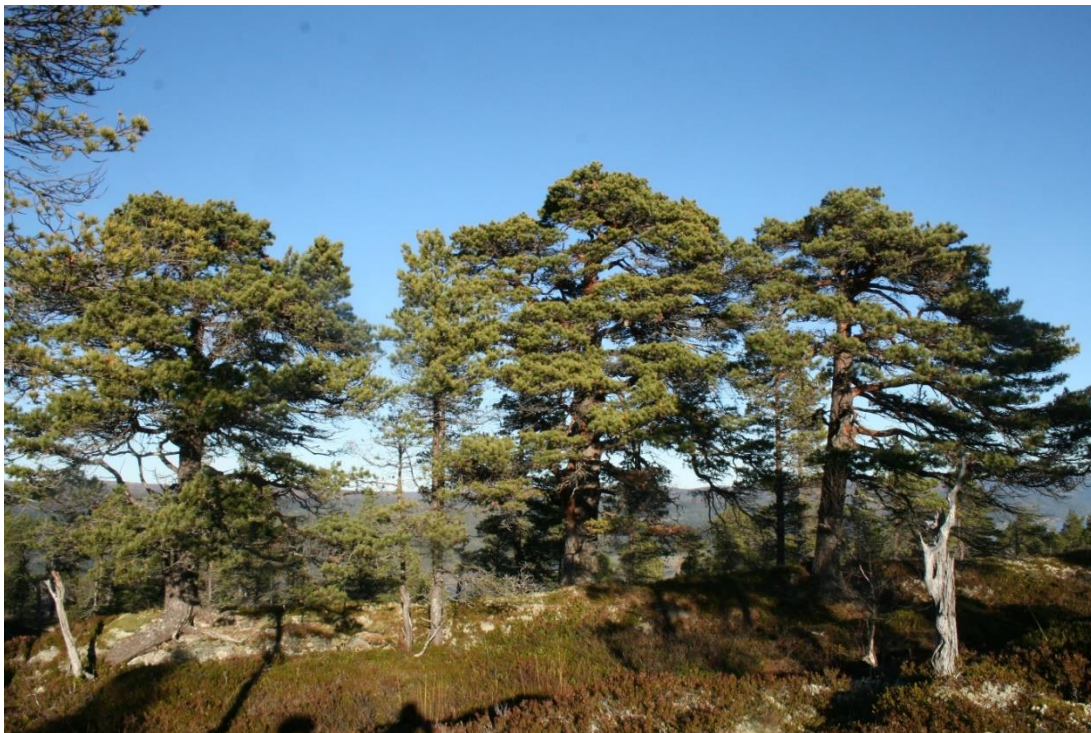
Gammel furuskog er vernegrnlaget i Røsheia.

Biofaglig inventør: Biofokus 2015 Jansson, Biofokus 2014 Jansson, Naturbase BN 00093407, Naturbase BN 00093369. Befaring ved Statsforvalteren.